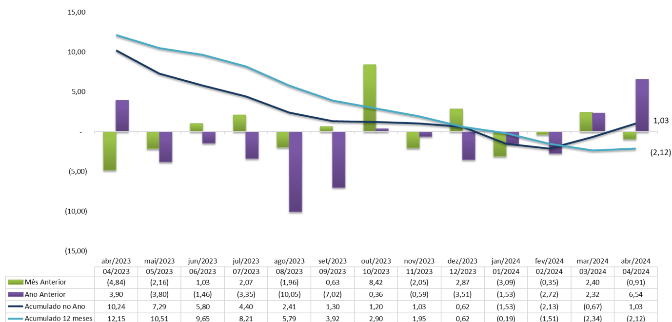
Gráfico 1 - Evolução histórica das variações em relação o mês anterior, mesmo mês do ano anterior, acumulado do ano e acumulado de 12 meses – abril de 2023 a abril de 2024

O comércio em geral encerrou abril de 2024 com queda em relação a março de 2024, de -0,91%, valor contrário ao crescimento de 2,40% do mês de anterior. Se comparado a igual período de 2023, houve uma elevação de 6,54%. Na variação do acumulado do ano está em elevação de 1,03% e, no acumulado de em 12 meses, queda de -2,12%.